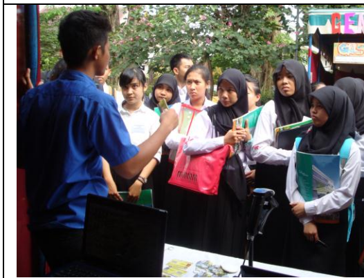
Promosi stand maba