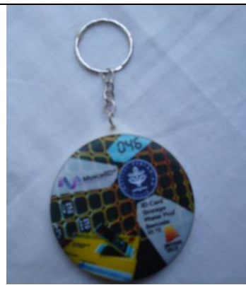
Soufenir sebagai media promosi